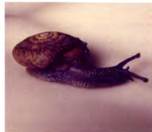
Voorplaat / Cover plate

Oestophora barbula in Driebergen (levend exemplaar; zijaanzicht).