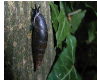
Voorplaat / Cover plate

Gladde clausilia ( Cochlodina laminata ) in Winterswijk, op Gewone es