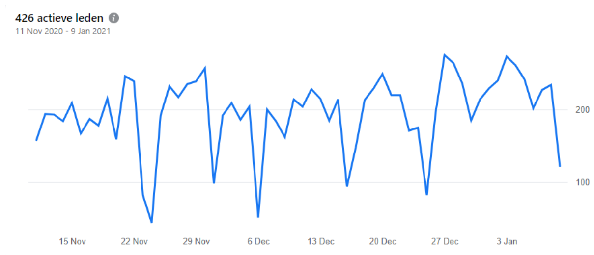
Figuur 2. Aantal bezoekers van de NMV-facebookpagina per dag, periode 11 nov. 2020 - 9 jan. 2021.

In figuur 2 is te zien hoeveel mensen onze facebook pagina dagelijks bezoeken of een post hiervan zien (dit kan dan ook de post in hun tijdlijn zijn). Het aantal ligt meestal tussen 100 en 250 mensen per dag.