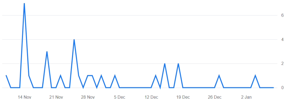
Figuur 1. Aantal nieuwe leden per dag van de NMV-facebookgroep, 10 nov. 2021 – 10 jan. 2022.

In figuur 2 is te zien hoeveel mensen onze facebook pagina dagelijks bezoeken of een post hiervan zien (dit kan dan ook de post in hun tijdlijn zijn). Het aantal ligt meestal tussen 100 en 250 mensen per dag. Wat uitkomt op bijna 10.000 keer dat één van de berichten gelezen is door een lid in 60 dagen.